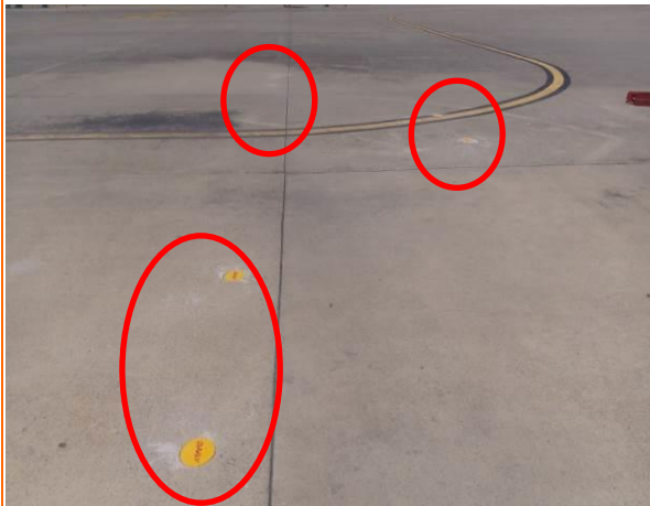
6 號停機坪型索機(覆蓋)