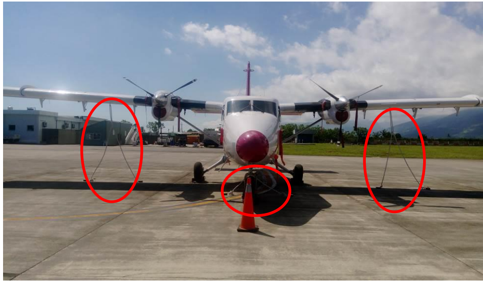
9 號停機坪實機栓繫