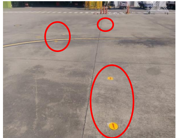
8 號停機坪型索機(覆蓋)

(二)鋼質材料為 SU304/316，馬蹄型不鏽鋼拉環( \Phi 12\text{ mm} \times 15\text{ cm} \times 30\text{ cm} )，可抗拉力為 10,000lbf、圓形蓋板( \Phi 15\text{ cm} \times 3\text{ mm} \times 5\text{ cm} )，內側附加鎖鍊固定，詳如下列照片。