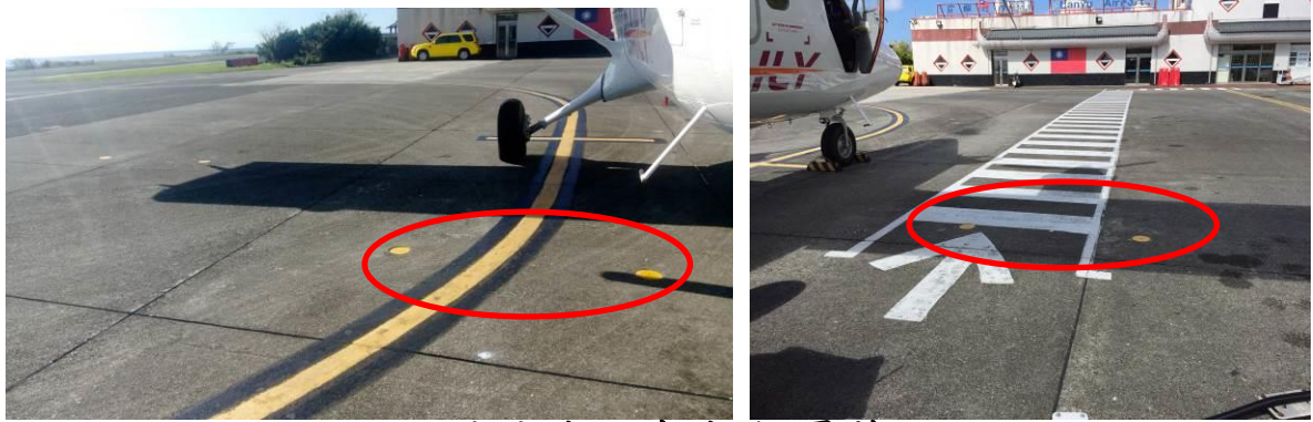
2 號停機坪索機樁(覆蓋)

(二)鋼質材料為 SU304/316，馬蹄型不鏽鋼拉環( \Phi 12\text{ mm} \times 15\text{ cm} \times 30\text{ cm} )，可抗拉力為 10,000lbf、圓形蓋板( \Phi 15\text{ cm} \times 3\text{ mm} \times 5\text{ cm} )，內側附加鎖鍊固定，詳如下列照片。